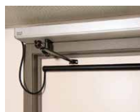
Door Automation 電動門