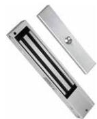
Electromagnetic Lock 電磁鎖