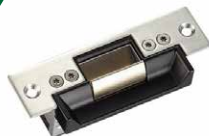
Electric Strike Lock 電鎖口