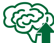
長者腦活動提升方案